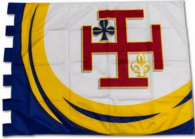
Flamme de camp :